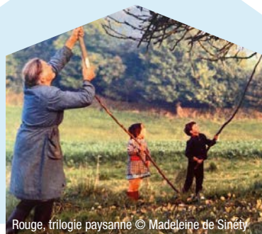
Rouge, trilogie paysanne © Madeleine de Sinéty